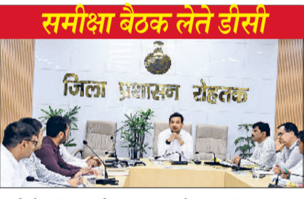
समीक्षा बैठक लेते डीसी

जिले में ग्रामीण क्षेत्र में स्ट्रीट लाइटें लगाने के लिए दो चरणों में 51 गांव चुने गए हरिभूमि न्यूज ▶▶ रोहतक