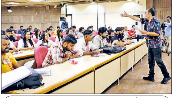
डीएलसी सुपवा में फिल्म कार्यशाला का चौथा दिन